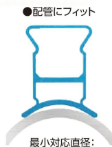
画像は、測定基準面がカーブしているイメージです。