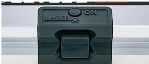
接触センサー (底部)