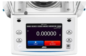
タッチパネル表示部