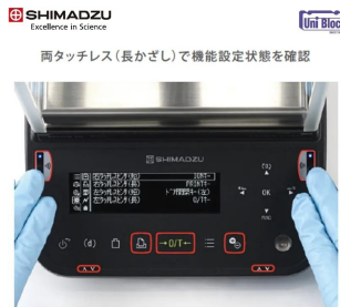
株式会社 島津製作所 画像は、タッチレスセンサの使用イメージです。