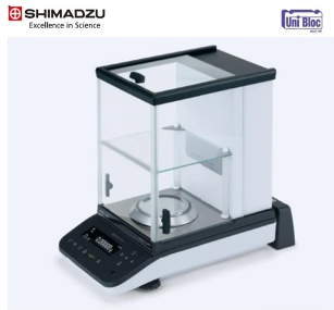
株式会社 島津製作所 画像は、ロゴマークなどの付いた商品イメージです。