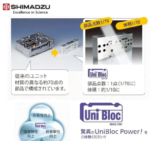
画像は、ユニブロックのイメージです。