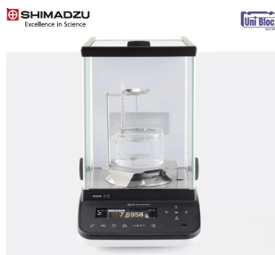
画像は、ロゴマークなどの付いた商品イメージです。