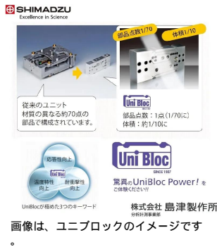
株式会社 島津製作所 画像は、ユニブロックのイメージです。