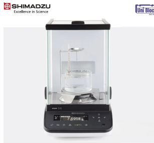
画像は、ロゴマークなどの付いた商品イメージです。