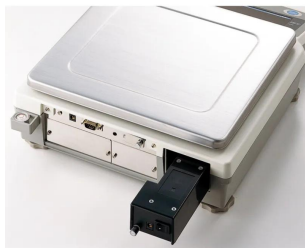
バッテリー装着時のイメージです