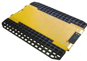
画像は、PAD単体のイメージです。