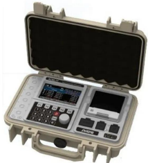
画像は、指示計：データBOXのイメージです。