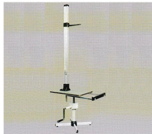
画像は、商品全体のイメージです。Y S 4 0 1-H 有限会社 吉田製作所