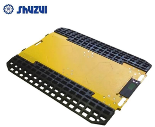
画像は、PAD単体のイメージです。