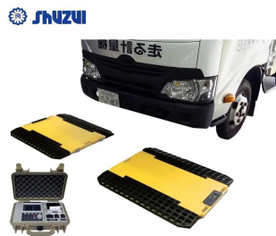
画像は、ロゴマーク等のついた商品イメージです。トラックは、商品に含まれません。