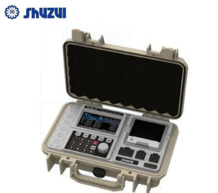
画像は、指示計：データBOXのイメージです。