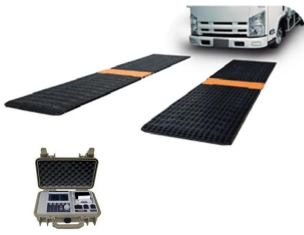
画像は、商品イメージです。トラックは、商品に含まれません。