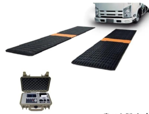
画像は、ロゴマーク等のついた商品イメージです。トラックは、商品に含まれません。