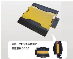
画像は、スロープ折りたたみ機能のイメージです。