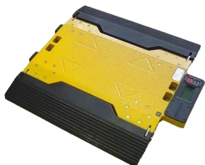
画像は、PAD単体のイメージです。