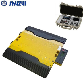
画像は、ロゴマーク等のついた商品イメージです。