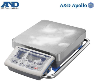
画像は、粉塵環境のイメージです。