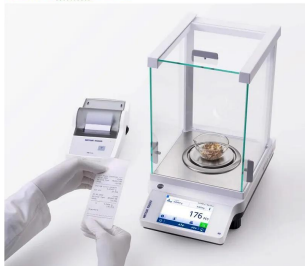
メトラー・トレド株式会社 画像は、プリンタ連動のイメージです。 。：ME204T