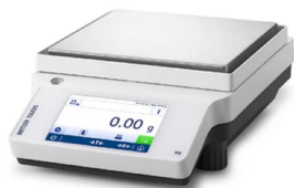
メトラー・トレド株式会社 画像は、商品イメージです。