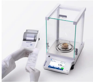
メトラー・トレド株式会社 画像は、プリンタ連動のイメージです。 。 : ME204T