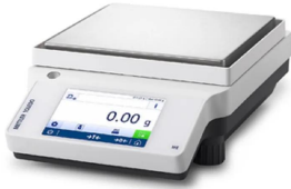
メトラー・トレド株式会社 画像は、商品イメージです。