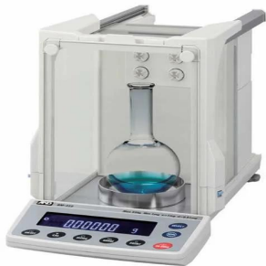
仕切板を外した状態でも除電可能