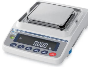
風防を取り外したイメージです。