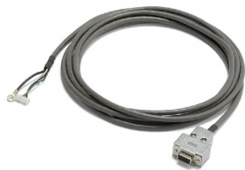
画像は、付属しているRS-232Cケーブルのイメージです。

昨今からのコロナ禍の影響により一部部品の入手が困難になっており、生産が当分の間出来なくなることが判明しました。 現在、生産を一時停止しております。 在庫のある場合がございます。都度お問い合わせ頂ますようお願い申し上げます。