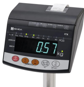
画像は、商品を内蔵し使用しているイメージです。