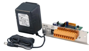
株式会社 エー・アンド・デイ 画像は、商品イメージです。