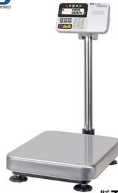
写真は、商品イメージです。