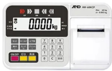
内蔵プリンタ付 CPモデル表示部