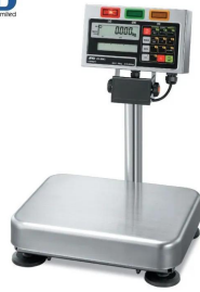
写真はシリーズ代表画像です。