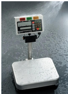
写真は、水滴が付く環境イメージです。