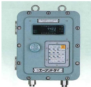
写真は、表示部のイメージです。