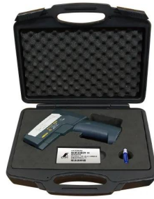
保管、持ち運びに便利な保護ケース付です。