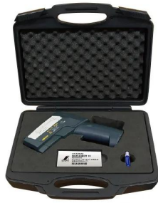
保管、持ち運びに便利な保護ケース付です。