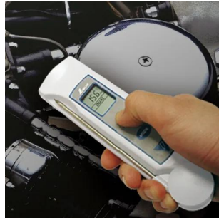
写真は、非接触での測定イメージです。