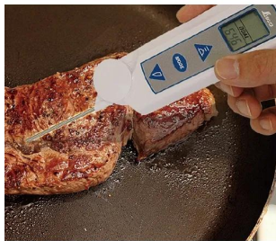
写真は、接触での測定イメージです。