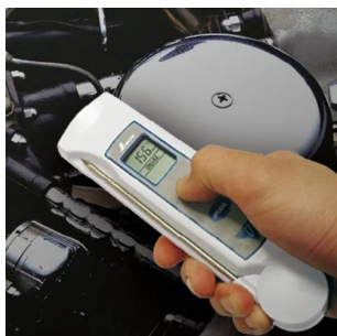
写真は、非接触での測定イメージです。