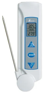
画像は、商品イメージです。