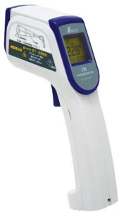
画像は、商品イメージです。