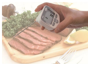
画像は、使用イメージです。