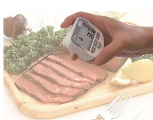
画像は、使用イメージです。