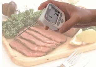
画像は、使用イメージです。