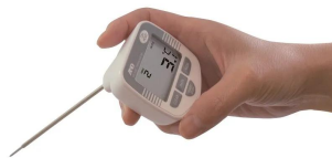
画像は、手で持った時のイメージです。