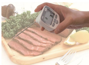
画像は、使用イメージです。