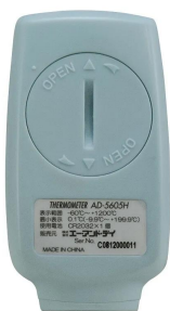
画像は、背面のイメージです。