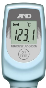
画像は、表示のイメージです。