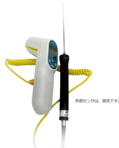
画像は、別売の K 熱電対センサを取付けたイメージです。