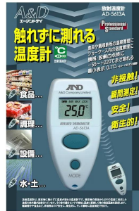
画像は、個包装のイメージです。