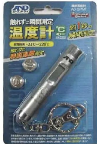
画像は、個包装のイメージです。