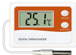
画像は、商品イメージです。