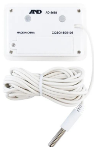
画像は、商品背面のイメージです。