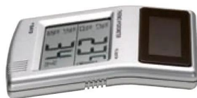
画像は、商品側面のイメージです。