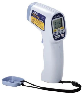
画像は、商品イメージです。