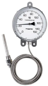
写真は、シリーズ代表画像です。