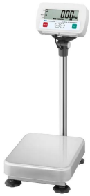
写真は、商品イメージです。