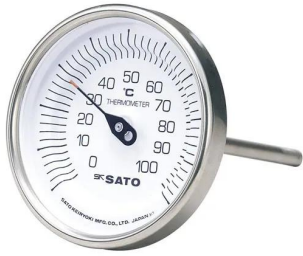
写真は、シリーズ代表画像です。