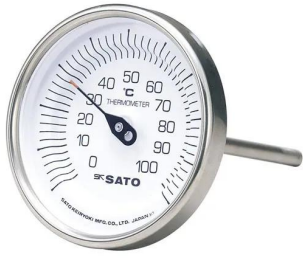
写真は、シリーズ代表画像です。