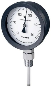
写真は、シリーズ代表画像です。