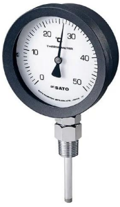
写真は、シリーズ代表画像です。