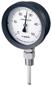
写真は、シリーズ代表画像です。