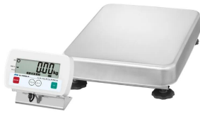
写真は、商品イメージです。