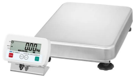
写真は、商品イメージです。