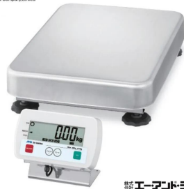
写真は、商品イメージです。