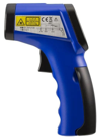
画像は、商品側面のイメージです。