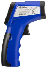
画像は、商品側面のイメージです。