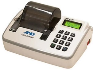
画像は、商品イメージです。