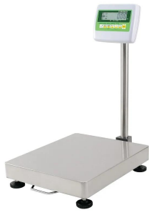
画像は、商品イメージです。