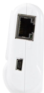
画像は、商品右側面のイメージです。