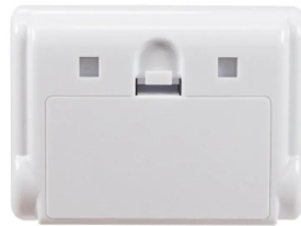
画像は、商品背面のイメージです。