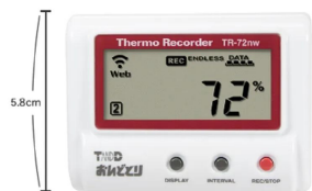
画像は、商品の大きさのイメージです。