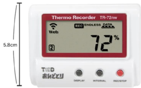
画像は、商品の大きさのイメージです。