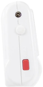
画像は、商品左側面のイメージです。