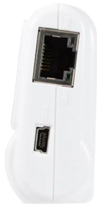
画像は、商品右側面のイメージです。