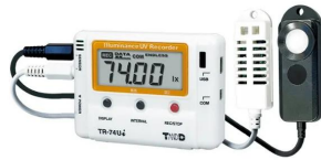
画像は、商品イメージです。