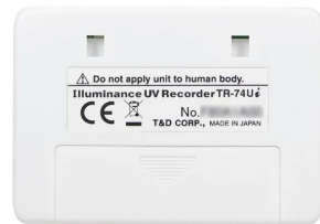
画像は、商品背面のイメージです。