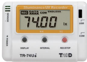
写真は、表示部のイメージです。